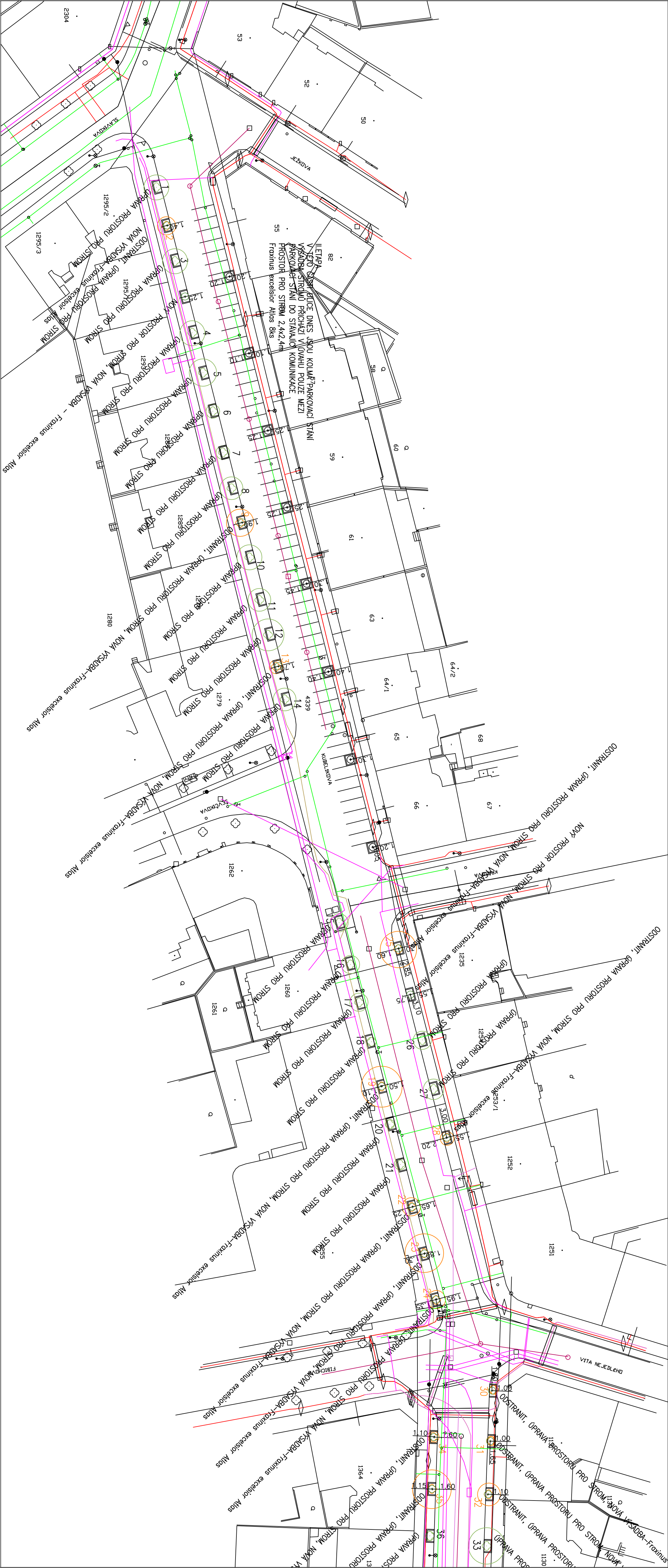
LEGENDA – INŽENYRSKÉ SÍTĚ: