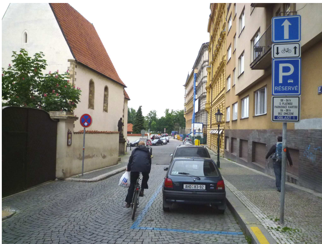
Pohled do ulice Říční (cyklista vyjel z ul. Šeříková a pokračuje směr Kampa)